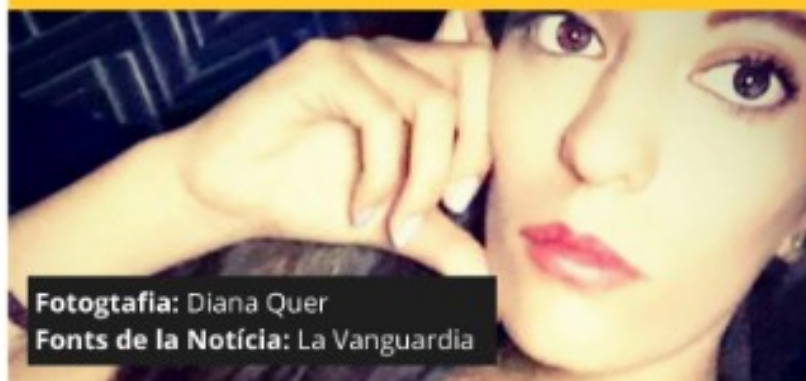
Fotografia: Diana Quer Fonts de la Notícia: La Vanguardia

Es parla de femicidi quan un home assassina a una dona pel fet de ser dona. Poden tenir diverses causes, com per exemple, l'odi, la gelosia, la ira o el concepte de la superioritat de gènere i pensar en la dona com a una possessió.